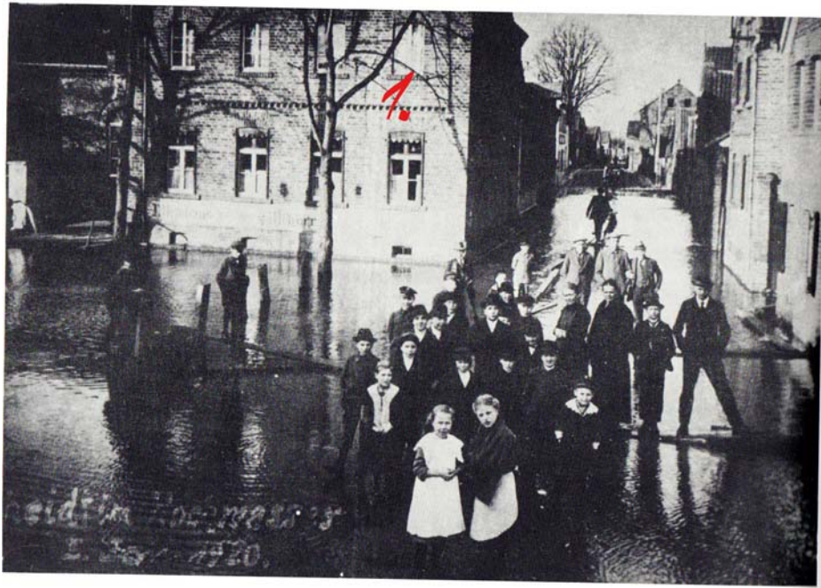
Lösungszahl Bild 1

Bitte notiert die Hausnummern der beiden Gebäude, die auf den Bilder erkennbar sind.